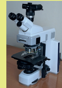
sciences de la vie